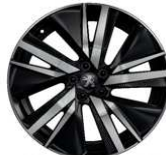
19" ALU platišča 'SAN FRANCISCO'