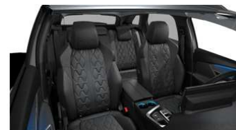
ALLURE / ALLURE PACK / GT / GT PACK (opcijsko) Usnje 'Nappa' Mistral - 8DFX