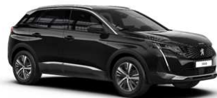
Črna Perla Nera - 9VM0