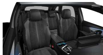
GT / GT PACK TEP & Alcantara® Mistral 'Glanon' - OJFI