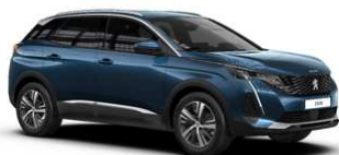
Modra Celebes - SYM0 SERIJSKA BARVA