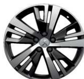
18" ALU platišča 'DETROIT' (Noir ONXY Brilliant)