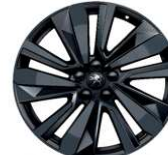
19" ALU platišča 'WASHINGTON'