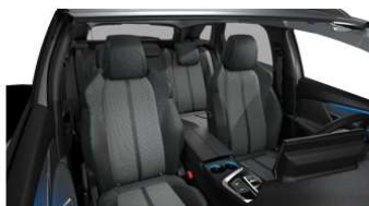
ALLURE / ALLURE PACK TEP & Tkanina 'Colyn' Mistral - 48FQ