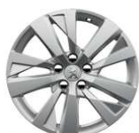
17" ALU platišča 'CHICAGO'