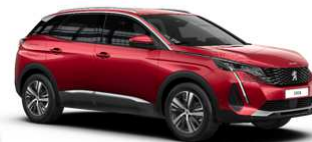
Rdeča Ultimate - F3M5