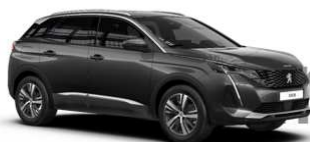
Siva Platinum - VLM0