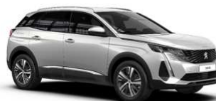
Bela Nacré - N9M6