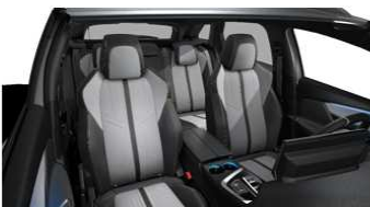
GT / GT PACK TEP & Alcantara® Greval 'Glanon' - OJFY