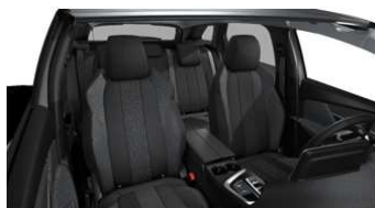
ACTIVE / ACTIVE PACK Tkanina 'Meco' Mistral - 47FX