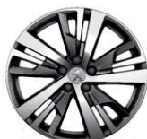
18" ALU platišča 'DETROIT' (GRIS Storm Brilliant)