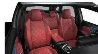
GT / GT PACK (opcijsko)