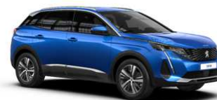
Modra Vertigo - SMM6