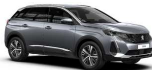
Siva Artense - F4M0