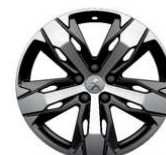
18" ALU platišča 'LOS ANGELES'