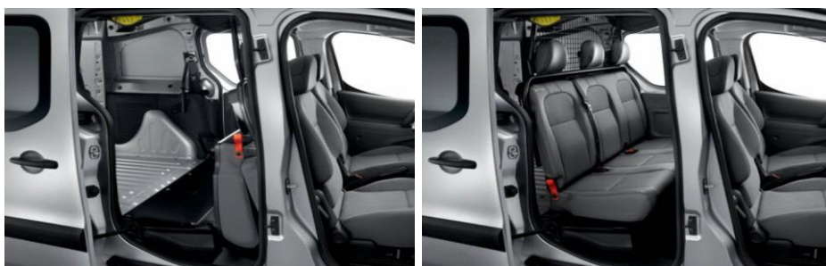
9WFZ - Siva notranjost iz tkanine NARBONNAIS Cabin Crew