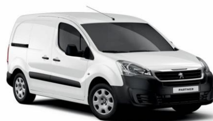
WPP0 - Bela Banquise