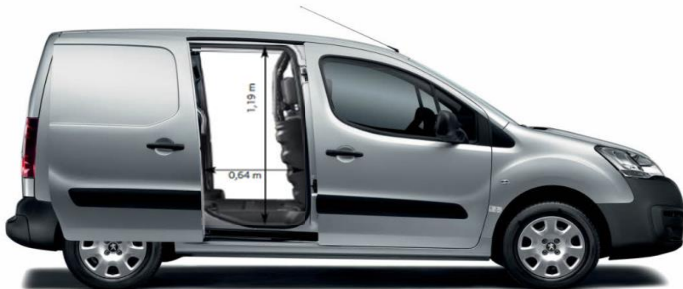
Dimenzije tovornega prostora L1 :