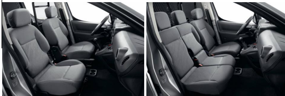
9WFZ Siva notranjost iz tkanine NARBONNAIS - Base, Confort