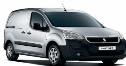
ZRM0 - Siva aluminium